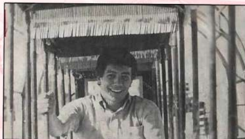
Αποκλειστική φωτογραφία από τον σκληρό δίσκο του Δάκη. Προφανώς μαι κίνηση που κλείνει το μάτι στην εγκληματικότητα και την παρανομία.

Κάναμε όνειρα τρελά με καταλήψεις παντού, σε κάθε γειτονιά