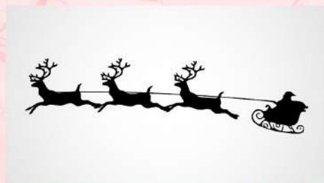
Αποκλειστικό στιγμιότυπο από το ειδικό ραντάρ της αστυνομίας

Χριστούγεννα και Υπακοή τέλος. Ζωή μαγική.