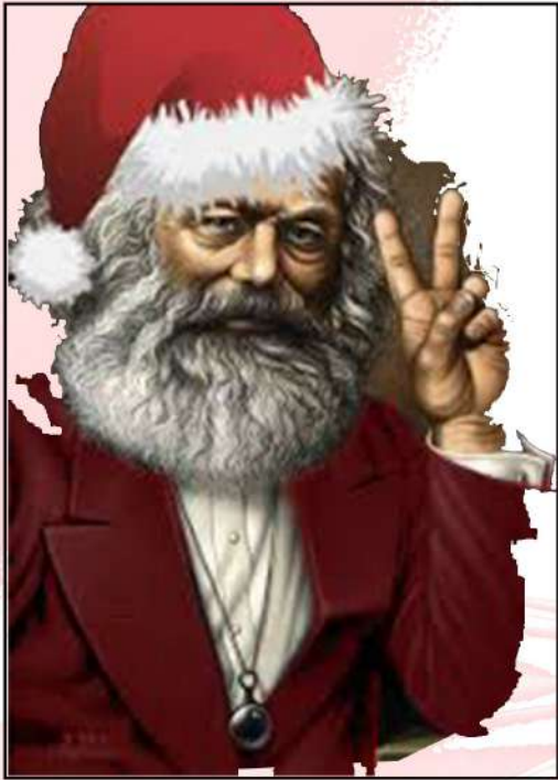
Σε αποκλειτικότητα, η φωτογραφία του Βασίλη, Κάρολου ή Κλάους.

Ιδιαίτερη ανησυχία προκαλεί η δυνατότητα εμφάνισης σε πολλές περιοχές ταυτόχρονα. Και ένα χαρακτηριστικό που οι Αρχές θεωρούν σημαντικό, είναι το χαρακτηριστικό γέλιο του κυρίου με τα κόκκινα και τα πολλά ονόματα. Το γέλιο του λοιπόν,